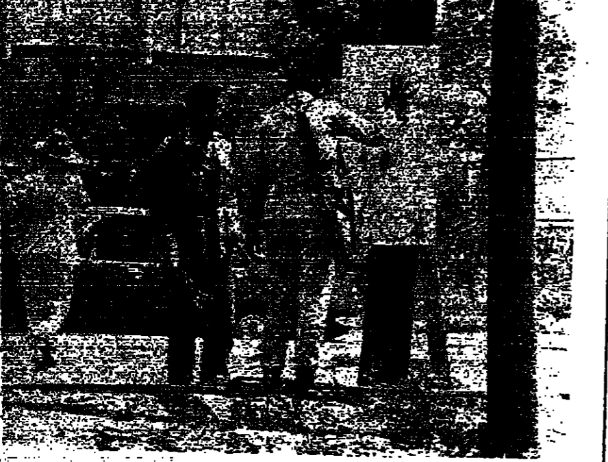
عصران من الدورة المشتركة في الكوئنة، يراقبان لوحة رسمتها نقابة كفاءه اطلاق الرصاص قبل ظهر امس